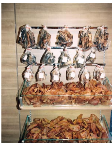
Selbst für Bello, Wuffi &amp; Co. ist in diesem Superladen bestens gesorgt