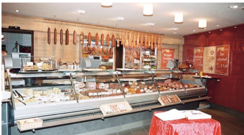
Aichinger hat mit diesem Fachgeschäft in Sollenau sicherlich neue Maßstäbe gesetzt; die Beleuchtung von Achleitner-BÄRO rückt die Spezialitäten ins rechte Licht