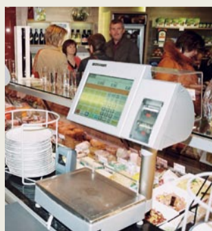
Das Kassen-Waagen-Verbundsystem von Bizerba funktioniert perfekt

Zum Senden von Werbung vom PC an die Waage.