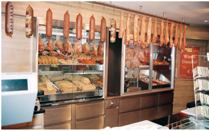
Auch die Rückwandgestaltung