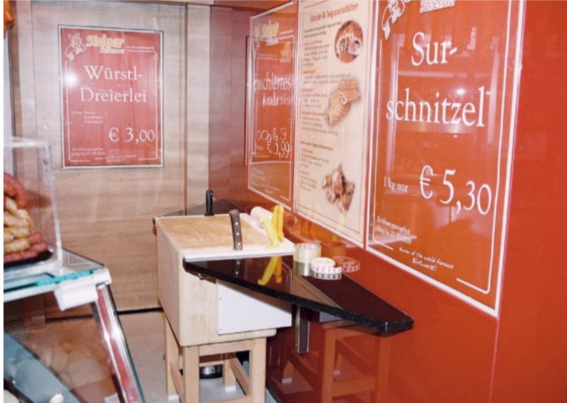
Jedes Detail in diesem Geschäft ist durchdacht und durchgestylt