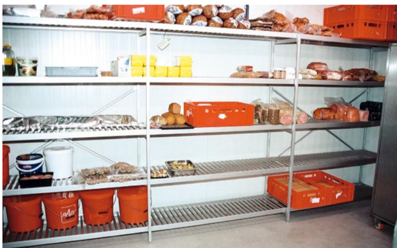
Vollkommen saniert wurde der Kühlraum hinter dem Geschäft. Die Paneele stammen aus dem Hause OK-Paneele