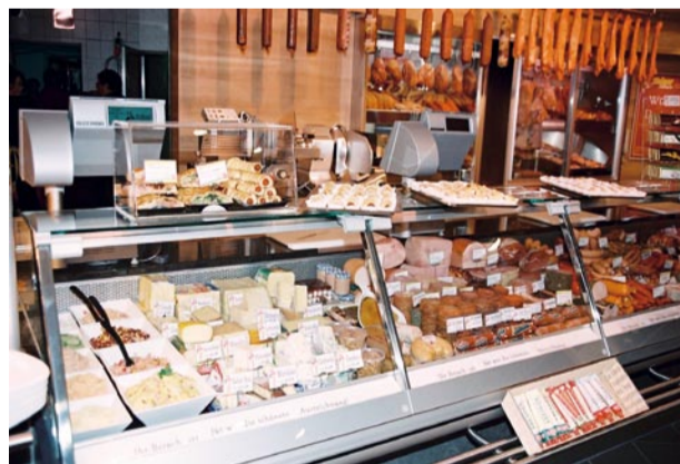
Alles, was das Schlemmerherz begehrt ...