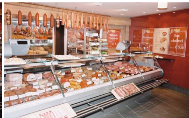
... erhält der Genießer in diesem wunderbar gelungenen, neuen Fachgeschäft der Steiner-Bernscherers in Sollenau