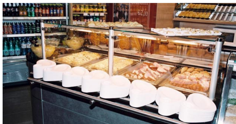
Mit dieser Imbissstheke, Modell „Gourmet“, kann der Heißhunger der Kunden jederzeit gestillt werden

aber auch die Grillschmankerln sowie die Halffertig- und Fertiggerichte. Der Umbau des Geschäfts wurde in zwei Phasen abgewickelt. In Phase 1 wurden schon zu Ostern die Küche und die Sozialräume getrennt und den neuesten Hygienestandards entsprechend gestaltet.