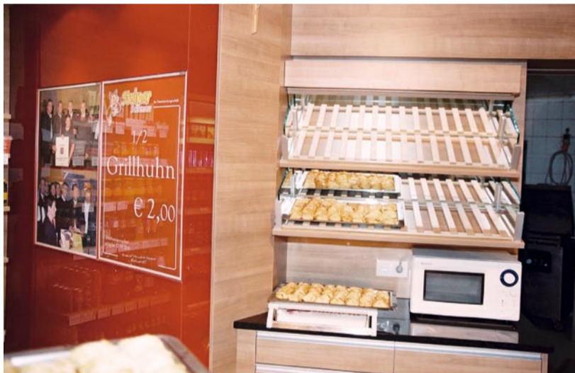
Auch für Brot und Gebäck ist genügend Platz