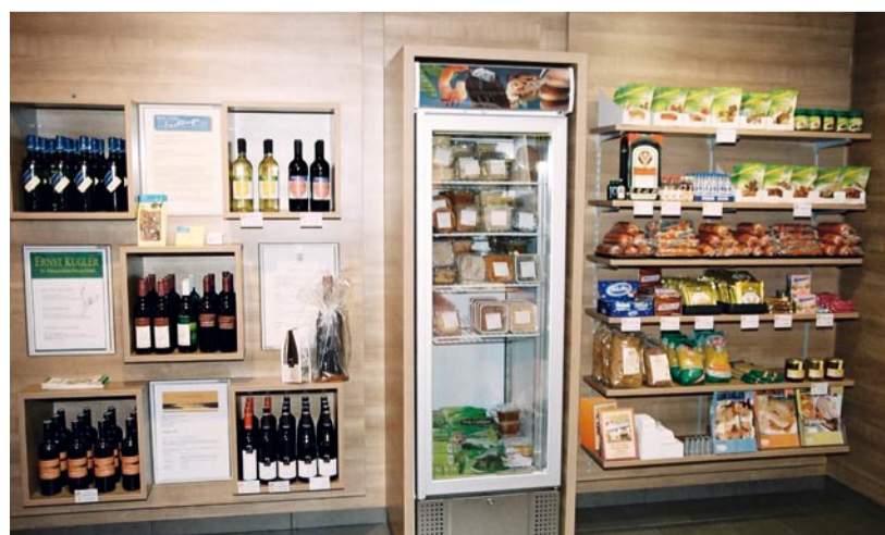
Weinliebhaber und Freunde typischer heimischer Schmankerln kommen ebenfalls auf ihre Rechnung